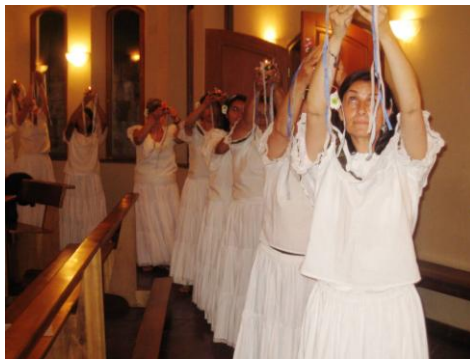
Ceremonia de clausura cursos CEBIPAL – 7 diciembre 2007

Para prolongar la meditación y la oración