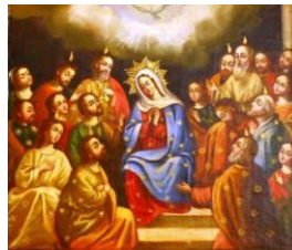
Detalle del Tríptico regalado por el Papa Benedicto XVI a los Obispos de América Latina y el Caribe en Aparecida-Brasil